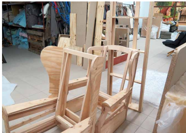
Výrobou a opravami dřevěných koster je pověřeno osvědčené truhlárství z Černiče

v současné době realizuje především opravy čalouněného nábytku, s kterým se lidé nedokáží rozloučit.