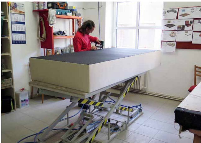
Součástí produkce jsou i čalouněné postele a opravy čalouněného nábytku